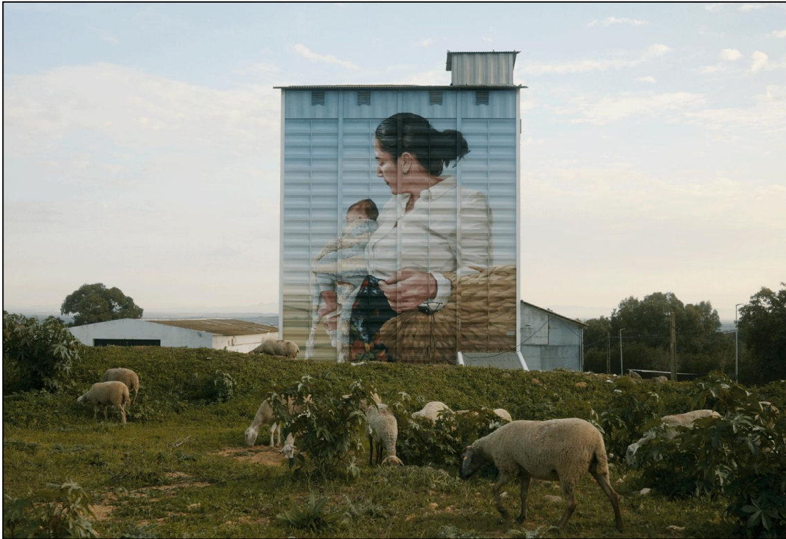
Virginia Bersabé El Viso del Alcor