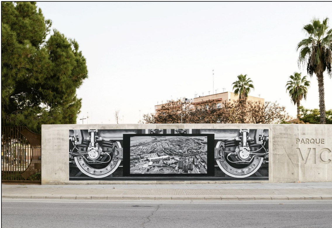
Pedro Almeida Camas, 2024