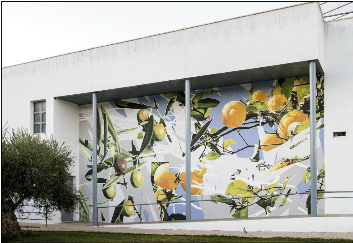
Alberto Montes Los Corrales. 2024